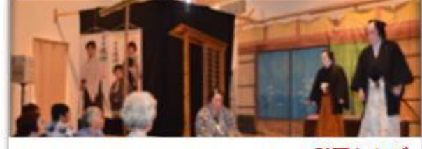
宗像わかば苑などの職員さんが名演技 劇団わかば