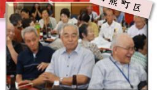
田熊町区敬老会より

「子ども達の歌、ひょっとこ踊り最高!炭坑節もみんなと一緒に踊って、楽しかった～」と参加された方々が、良い笑顔だったのが印象的でした。