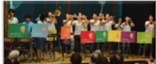
市内で活躍中! Mama&Kids Berry☆Band

in 東郷コミセン 皆様 いつまでもお元気で～！ 東郷コミセンでは、東郷村区・大井南区・三倉区・和歌美台区が合同で「敬老お祝い会」を行いました。他区の「敬老祝賀会」にも広報委員がお邪魔してきました。