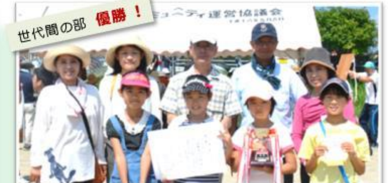
【世代間の部】優勝:田熊区 準優勝:東郷町