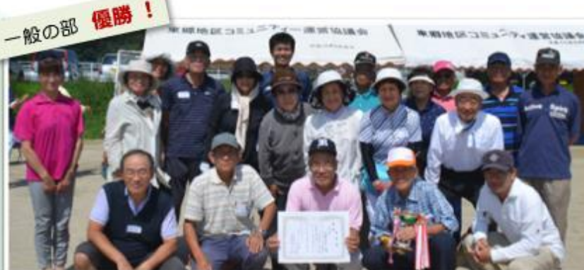
【一般の部】優勝:三倉区A 準優勝:東郷町A 上記4チームは、11月2日(日)ふれあいの森での親善交流グラウンドゴルフ大会(中大会)へ出場します。みなさん応援をお願いします!

まさかの?! 三倉区初優勝!! 東郷地区コミュニティ親善グラウンドゴルフ大会で、我が三倉区Aチームが、自分達も驚きの初優勝を果たしました。優勝はもちろんですが、ペテランもそうでない人も、2チーム17人全員が、元気に楽しくプレーできたことを、嬉しく思います。と言いつつも、「賞状をどこに飾ろうか?」などと、勝利の美酒?を飲みながら、打ち上げでは盛り上がりました。 (三倉区 池田洋一)