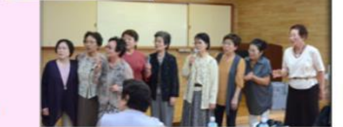
みんな熱唱! カラオケ大会♪