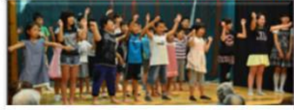
かわいいダンスと歌声 和歌美台区子ども会