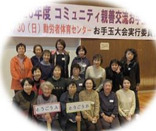
今年度 コミュニティ親善交流お 手玉大会 11月30日(日) 勤労者体育センター お手玉大会実行委員