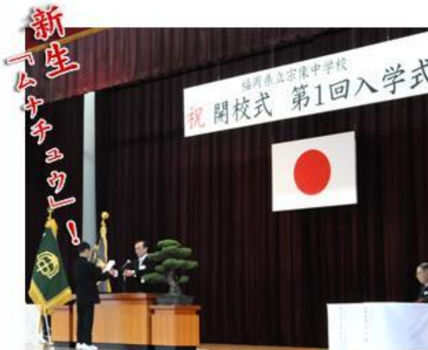
【県立宗像中学校 第1回入学式】 4月7日(火) 入学生79人

今春、東郷地区に新たな学校が増えました。新入生のみなさんは、 学校に慣れた頃でしょうか?宗像高校は、宗像中学校→宗像 実業女学校等を経て高校となった経緯があるので、年配の方 の中には、「宗中」と聞くと懐かしく思われる方もいらっしゃる かもしれませんね~