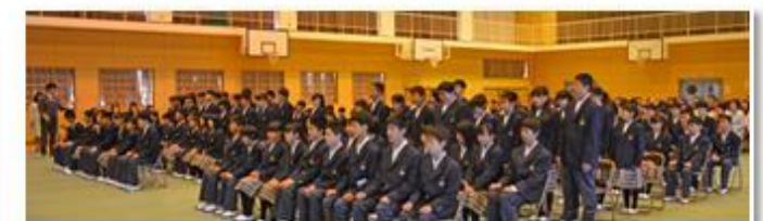
【宗像市立中央中学校 第69回入学式】 4月9日(木) 入学生108人