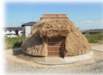
竪穴式住居も再現されています