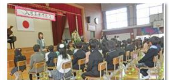
【宗像市立東郷小学校 第142回入学式】 4月10日(金) 入学生100人