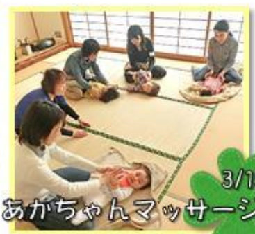
3/15 あがちゃんマッサージ

子育て仲間と楽しい時間を過ごしてみませんか? 都合の良い時間に気軽に遊びに来て下さいね!