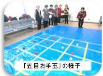
「五目お手玉」の様子

日時: 毎月第1週水曜日 14:00～1時間程度 場所: 東郷コミセン 大会議室