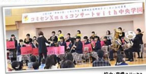
協力: 宗像ユリックス

中央中吹奏楽部、またユリックスジュニアプラスに属する東郷小の2人も合奏に加わり、みなさんとクリスマス前のひとときを楽しむことができました。