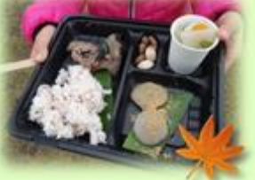
今みたいに調味料もない弥生時代のように素材の味を体験してみませんか?

今年もいせきんぐ菜花園での古代米(赤米)収穫を記念して秋祭りを開催します。 赤米ごはん、ジビエ料理、木の実、古代菜汁などを体験(無料)していただきます。弓矢体験、勾玉づくり、原始はた織り、木棺づくりなどの学習体験も行います。 また、ステージイベントも開催予定です。詳細はタウンプレス11月号で紹介します。お楽しみに!