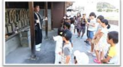
東郷地区の皆様一度ご参加されたらいかがでしょうか?

今年もお地蔵さんの縁日である8月23日(水)の千灯明がやってきました。例年のごとく、子ども会(約25人)が中心となり行事が執り行われました。延暦寺ご住職の読経の後、みんなでたくさん火を灯して一人ひとりが手を合わせてお祈りしました。お参り後、「スイカ割り」や「輪投げ」「ヨウヨウすくい」などで楽しみました。