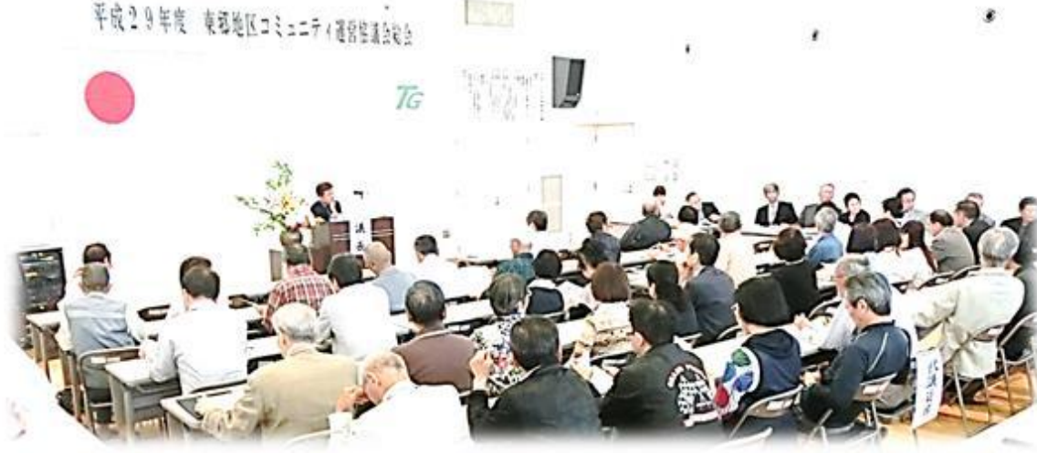
～5月14日(日)に29年度の総会を無事に終えることができました～