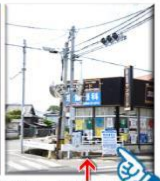
JA東郷支店前(スポーツ用品店横) 橋はココです!

西祇園橋を なおしています 平成29年7月14日まで 時間帯 8:30~18:00 西郷地区建設事務所 電話 0940-36-2022 施工 西郷地区土木建築事務所 電話 092-627-1965 (緊急)電話 080-5270-7339