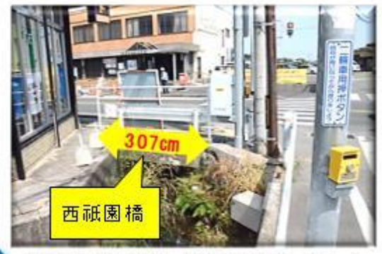
橋の下に見える水路 (水路の幅は190~200cm)