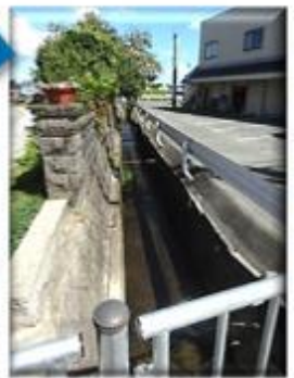
祇園橋から見た水路

60cmの歩幅で歩いたら ほんの4~5歩で 渡ることでできる橋… あなたの近くにも あるかもしれませんね~