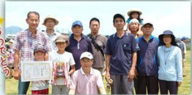
世代間の部 優勝 和歌美台のみなさん