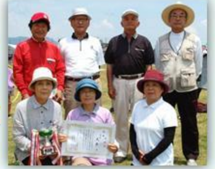
一般の部 優勝 久原のみなさん