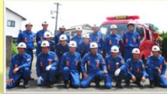
消防団第8分団の皆さん