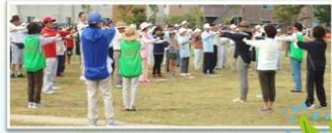
最初にみんなで「わかめ体操」 わかめのように～ユラユラ～♪

【東郷地区の人口】 世帯数: 4,342世帯 / 人口: 9,914人 (男性: 4,706人・女性: 5,208人) 先月未からの増減-16