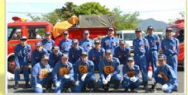
消防団第9分団の皆さん