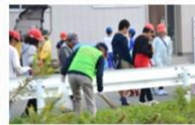
小中一貫校区愛着活動