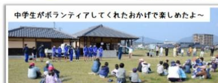
中学生がボランティアしてくれたおかげで楽しめたよ~