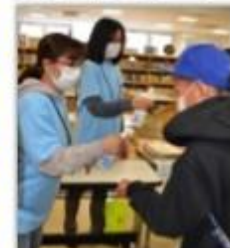
入館時には手指消毒

新型コロナウイルス感染予防対策のため延期になっていた自転車交通安全教室。今年度は、様々な事項を考慮し東郷コミセンで東郷小学校6年生のみでの開催としました。自転車で通学するようになる6年生に、自転車点検の大切さ、前かごに荷物を載せるとハンドルを取られる体験、先輩からの危険箇所説明等、一度体感し体験してほしいという地域、学校の強い思いから、今回の開催の運びとなりました。