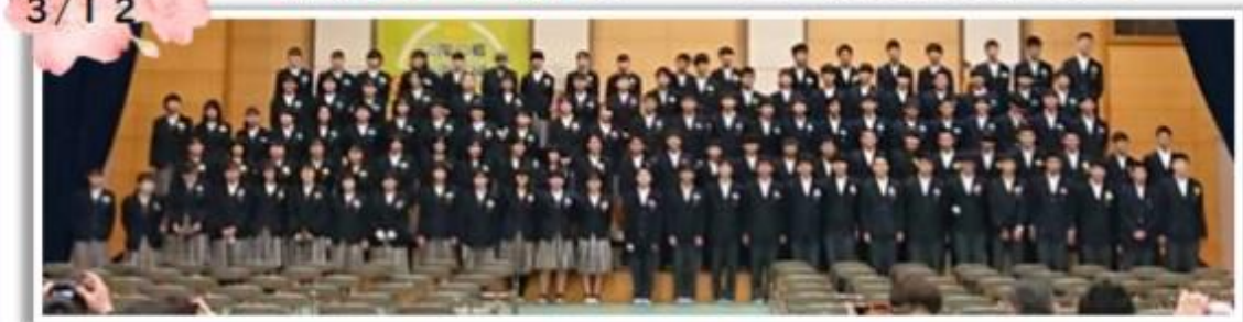
男子64人 女子60人 計124人