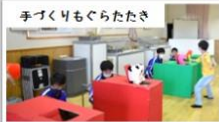
手づくりもぐらたたき