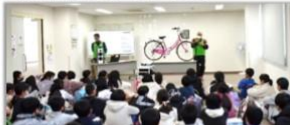
自転車に愛情を注いでね!