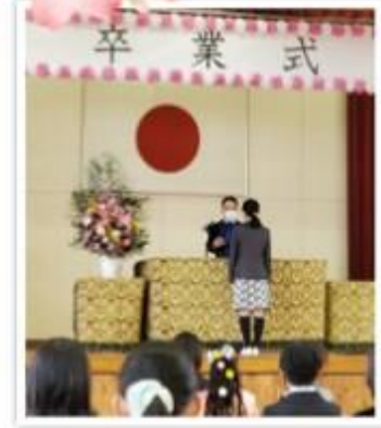
男子54人 女子53人 計107人

桜がほころぶ晴天の日、新型コロナウイルス感染拡大防止のため規模を縮小して行われた第147回の卒業式。卒業生、保護者、先生方だけの開催でしたが、担任の先生から想いが込められた一人ひとりの名前が呼ばれ、壇上で校長先生から卒業証書を受け取りました。また、卒業生からのメッセージの言葉は、ビデオレターとしてスクリーンに映し出され、保護者は小学校での6年間を思い、涙をこらえきれない様子でした。コロナ禍の中、行事の中止や延期を何度も経験し、それでも出来ることを「進んで みんなで 最後まで」前向きに過ごしてきた107名の卒業生。この1年でたくましく成長した彼らへ、たくさんの方々からの愛溢れる素敵な卒業式のプレゼントだったと思います。卒業生の皆さん！本当にご卒業おめでとうございます！