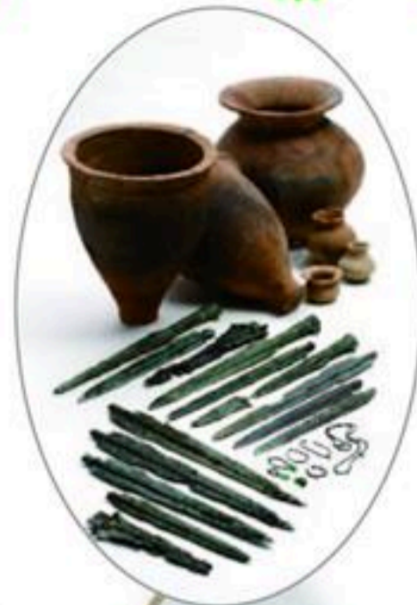
たぐまいしはたけいせき 田熊石畑遺跡の主な出土品