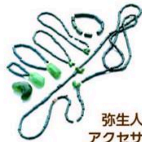
弥生人のアクセサリ

平成27年に世界文化遺産国内推薦を受けた『神宿る島』宗像・沖ノ島と関連遺産群の成立前夜に誕生した宗像人(むなかたびと)のルーツといえます。