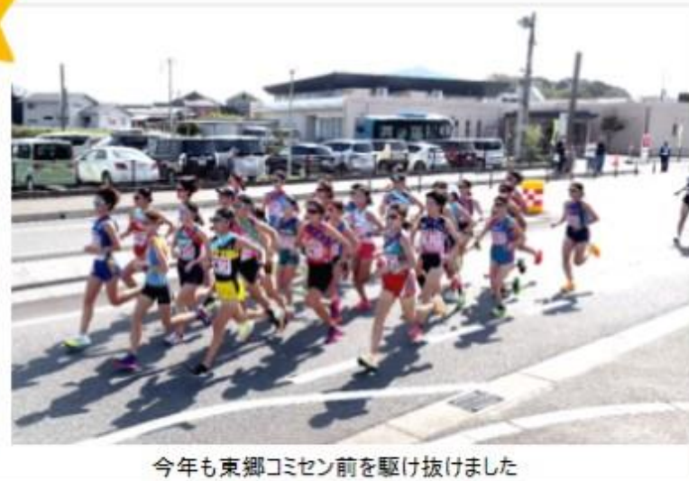
今年も東郷コミセン前を駆け抜けました