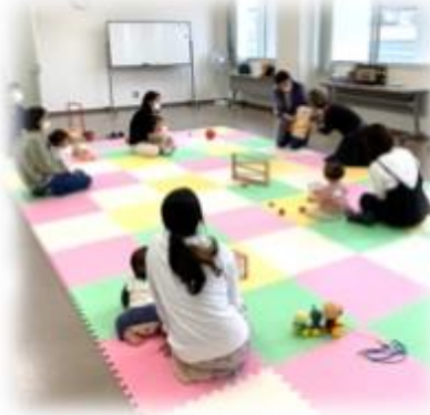
「いないいないばあ」の読み聞かせにくぎづけ!

まだまだ特別なイベントはできそうにありませんが、ママ友作りにぜひ遊びに来てください。