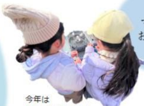
今年は コンロで焼いたよ