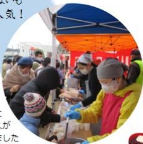
神事後は ぜんざいと 白玉きなこに たくさんの方が 並んでくれました