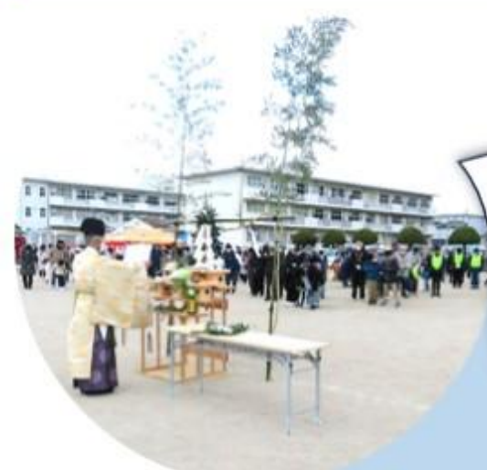
摩利支神社の 宮司さん 10:00～ 神事