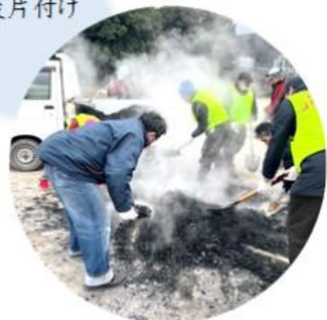
部員さん サポーターのみなさん お疲れ様でした!